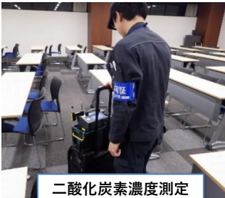
二酸化炭素濃度測定